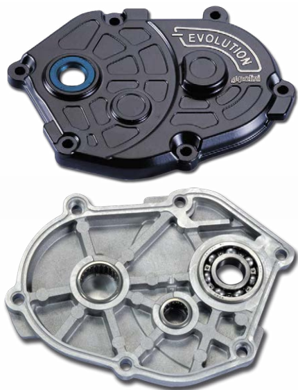
170.0301 Horizontal Yamaha - Minarelli long case engine Motore Yamaha - Minarelli orizzontale carter lungo

Polini Evolution gear box è il nuovo carter ingranaggi pressofuso in alluminio. Rispetto al carter originale si distingue per consentire il montaggio sui cuscinetti dell'albero intermedio e dell'albero ruota. Questa caratteristica migliora decisamente l'affidabilità e le prestazioni in quanto vengono eliminati i problemi di scorrimento dei due alberi trasmissione che, sul carter originale, scrono direttamente sul materiale del coperchio. Viene fornito completo di anello tenuta in FKM con inserto in PTFE a basso coefficiente di attrito specifico per ridurre ogni tipo di attrito e favorire lo scorrimento dell'albero primario e di guarnizione OR in sostituzione dell'originale per facilitare eventuali lavori di manutenzione. L'Evolution gear box si può montare utilizzando sia gli ingranaggi originali sia quelli con rapporti allungati e consente il montaggio dei diversi modelli di variatori maggiorati.