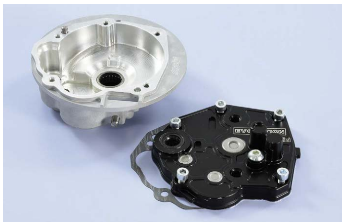
170.0309 Piaggio Ciao - Si