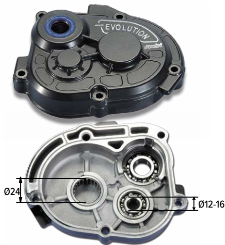
170.0300 Ø12 Piaggio engine for Polini gears with bearings → 2001 Motore Piaggio Ø12 per ingranaggi Polini con cuscinetti → 2001 170.0299 Ø16 Piaggio engine for original gear → 2001 Motore Piaggio Ø16 per ingranaggi originali → 2001