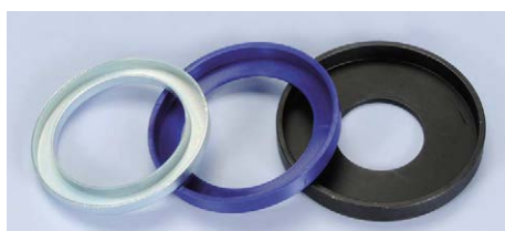
246.046 Yamaha TMAX