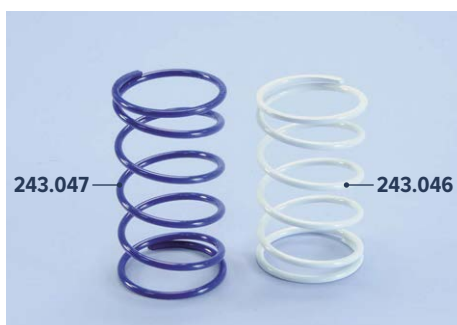
243.043 Piaggio ZIP EVOLUTION